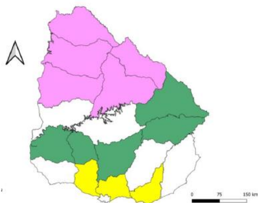
Figura 1. Sitios de vigilancia de Aedes aegypti con el sistema de ovitrampas. Uruguay, desde SE 35 de 2024 hasta 2025 SE 03.

Referencia: Norte (violeta). Centro (celeste), Sur (amarillo).